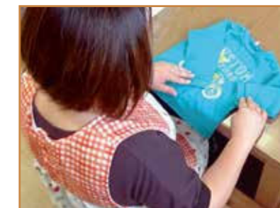
衣類の状態をチェック

確認後、性別、サイズ、種類等が分かるように 保管 し、季節ごとに分けて 事務局に送ります 。(年2回程度)