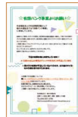
園内掲示のポスター

園日より等の広報誌や連絡帳アプリを活用し、保護者や地域の皆様へ 衣類の寄付を呼びかけ ます。