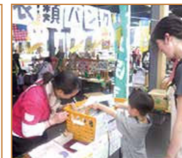
地域のお祭りブースでの呼びかけ