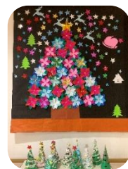
12月 クリスマスツリー