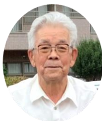
わたなべ 渡部 様 わたる 渡 様 デイサービス